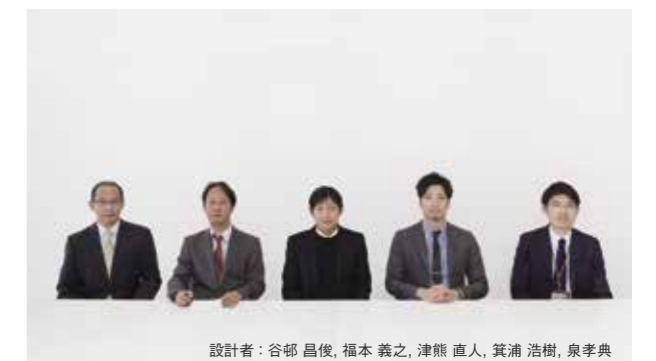
設計者：谷部 昌俊、福本 義之、津熊 直人、箕浦 浩樹、泉孝典

ある法則によって生み出される多様性は、植物や樹木のように自然の法則によって生み出される多様性に通じるものがあると考え、周辺の雄大な自然と融合し、木漏れ日のような柔らかい建築を目指したものである。